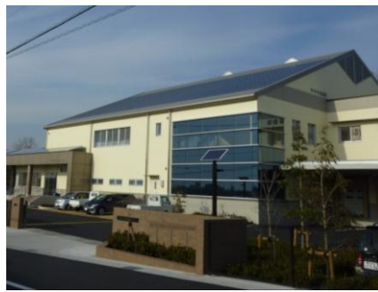
長久手給食センター (愛知県長久手市)