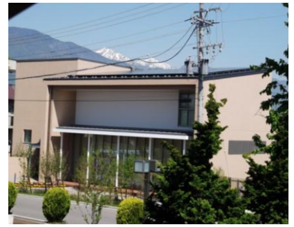
松本市梓川図書館 (長野県松本市)