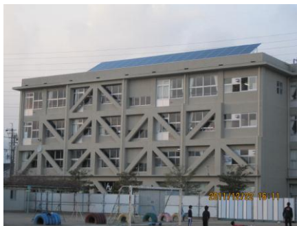
中川小学校 (岐阜県大垣市)