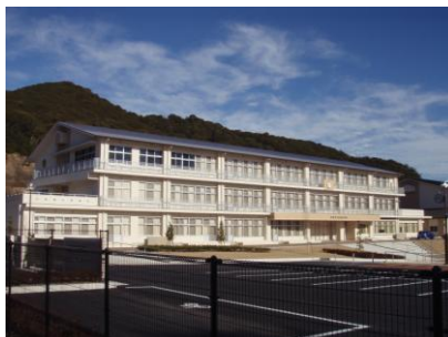
浜島小学校（三重県志摩市）