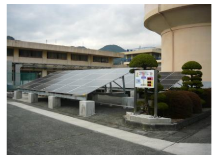
清水谷浄水場（静岡県静岡市）