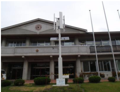
軽井沢西部小学校（長野県軽井沢町）