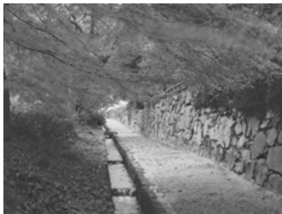
おごと温泉から車で約10分の距離にある、比叡山延暦寺の門前町として栄えた坂本地区。今も「穴太積み」という独特の石積みが街の随所に残り、美しい街並みを誇っている。