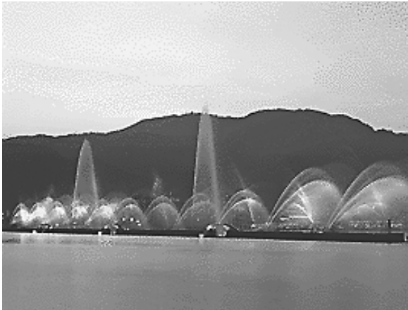
「びわこ花噴水」。大津港沖合180m防波堤上にあり、長さ約440m、高さ約40m（10階建てビルに相当）の大噴水。横の長さは世界一で、夜はライトアップされる。