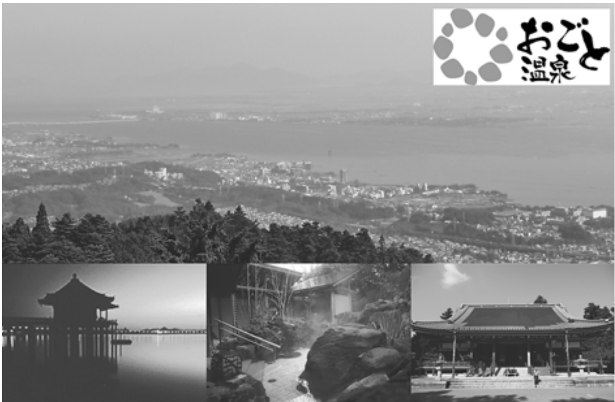
比叡山延暦寺へと上る坂本ケーブルの車内から望む琵琶湖に面したおごと温泉一帯。美しい自然に恵まれた琵琶湖の景観はもとより、周辺には世界遺産である比叡山延暦寺(写真下右)、坂本の日吉大社、近江八景の一つ堅田の「浮御堂（うきみどう）」(写真下左)、三井寺など観光名所も多い。写真左上にあるのが、琵琶湖を横断する「琵琶湖大橋」

※おごと温泉の表記は、漢字表記の「雄琴温泉」が一般的だが、今回は、おごと温泉旅館協同組合の取り組みをわかりやすく伝えるために「おごと温泉」として紹介する。