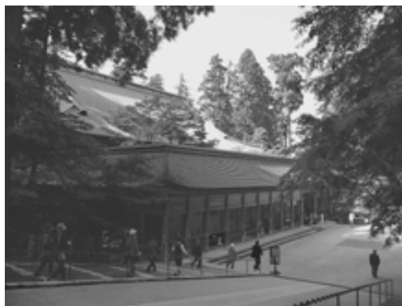
最澄が開いた世界遺産・比叡山延暦寺根本中堂。おごと温泉はこの比叡山の麓に広がる温泉地で、同じく最澄によって開かれたと言われている。

またその邸宅からはよく琴の音が聞こえてきたことから、「琴」をとって、「雄琴」となったという。