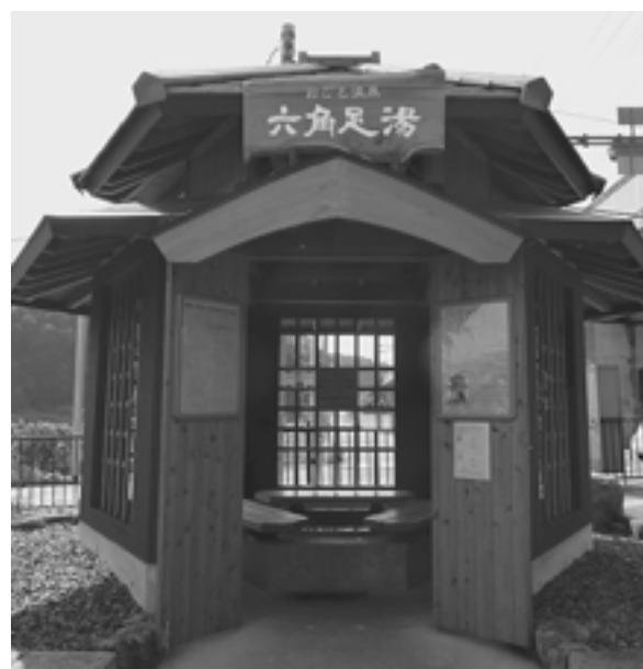
おごと温泉駅前に設置された足湯

また、組合では、駅名の改称とともに、駅前に足湯を設置。伝教大師最澄によって開湯したと伝わることから、その最澄が自作した石地蔵を祀る大津市坂本の日吉大社前にある早尾地蔵尊にある