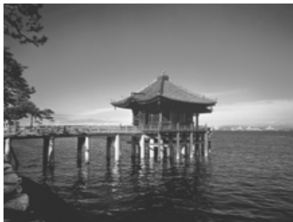
近江八景「堅田の落雁」で名高い浮御堂。寺名を海門山満月寺といい、平安時代、『源氏物語』に登場する横川の僧のモデルと言われる恵心僧都が建立したお堂。