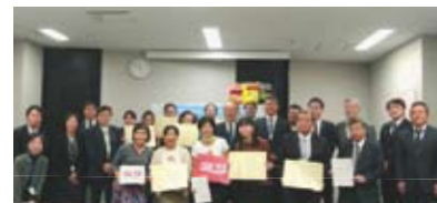
第1回表彰式後の様子